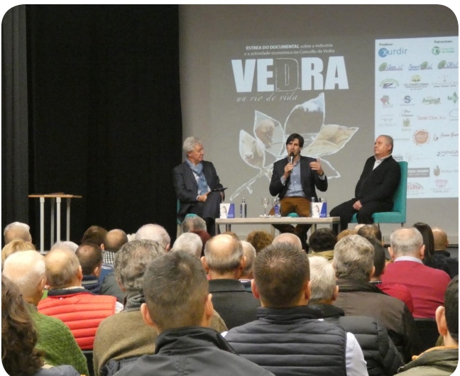
Presentación do documental Vedra, un río de vida.