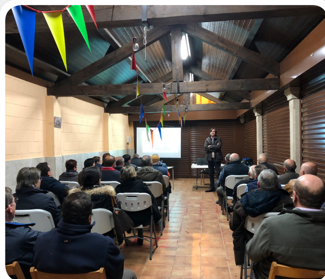
Charla prevención de incendios en San Xián.