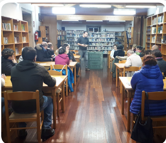
Entrega de 30 novos composteiros en Vedra.