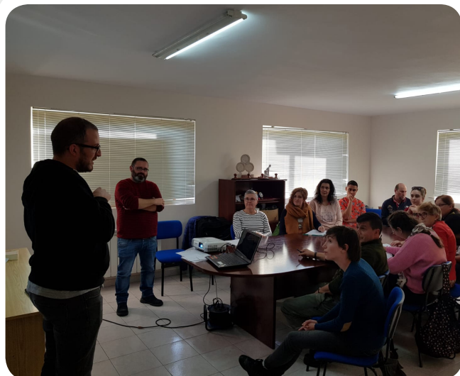
Curso Lingua de Signos impartido pola Asociación de Persoas Xordas.