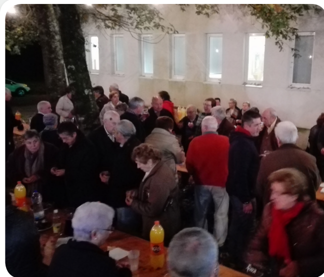
Baile e magosto da terceira idade.