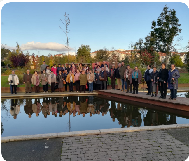
Excursión a Allariz da terceira idade.