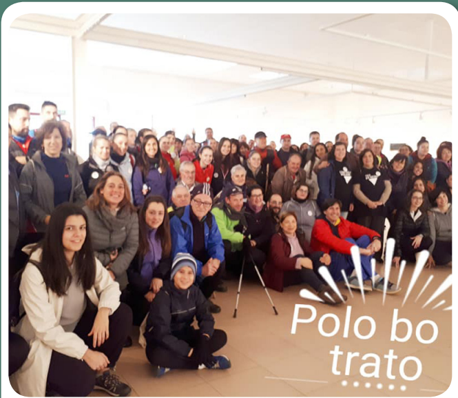
Il andaina Polo Bo Trato da Asociación Berenguela pola Igualdade.