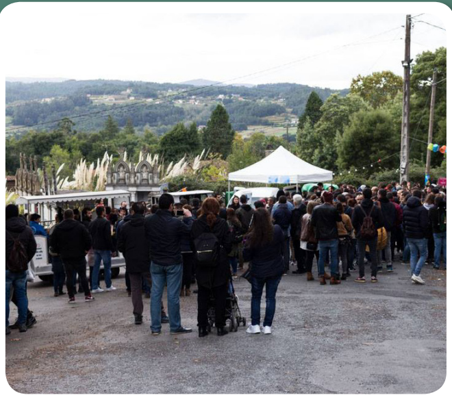
Pasabodeghas 2018 da Asociación San Campio.