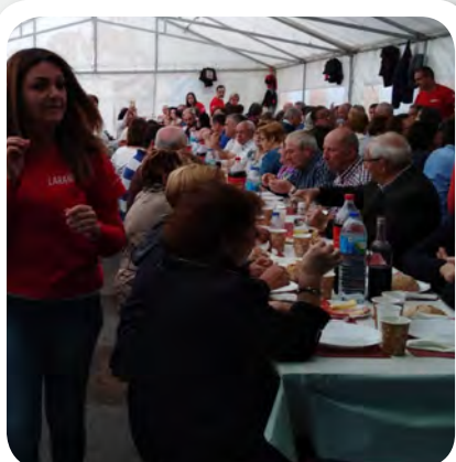
Festa do Carneiro ao Espeto en San Xián.