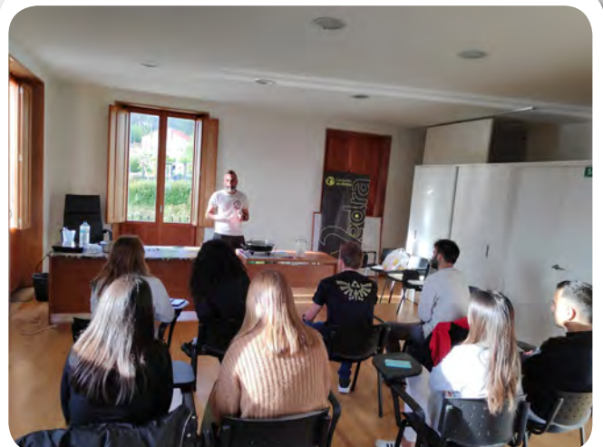
Obradoiro de cociña erótica no Posta a Punto.