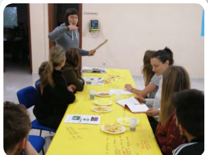
Curso de igualdade e prevención da violencia de xénero.