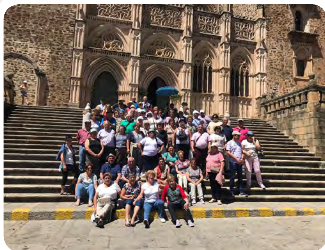
Excursión da nosa terceira idade a Extremadura.