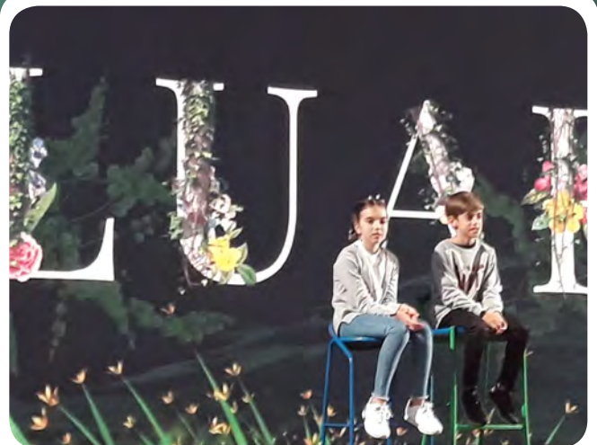
Membros dos Campiños da Asociación Cultural San Campio no Luar.