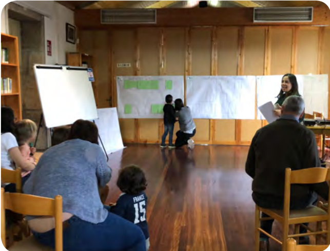
Programa cultural das nosas letras... Sábado 11 de maio ás 11:00 h. na biblioteca: A ruleta do coñecemento.