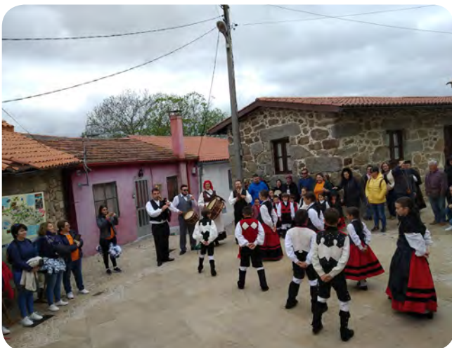
Os campións da Asoc. Cultural San Campio na Romaría Etnográfica Raigame.