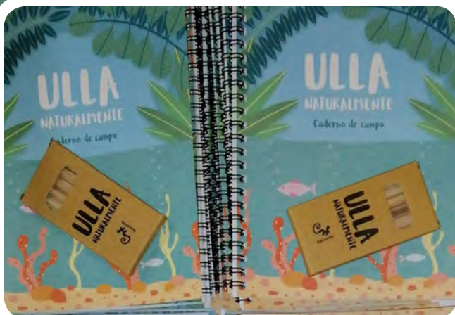
A Asociación Raiceiros está a desenvolver nos centros de ensino da comarca os obradoiros "Ulla Naturalmente" que teñen de base o caderno de campo.