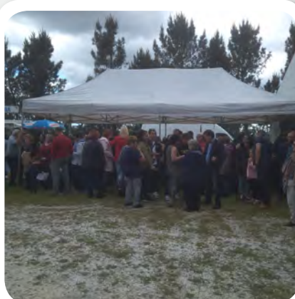
Así foi Vedra Festeira Festa do Porco á Brasa en Trobe.