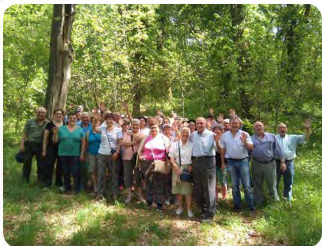
Excursión ás Termas de Outariz e paseo pola Fraga de Catasós da terceira idade.