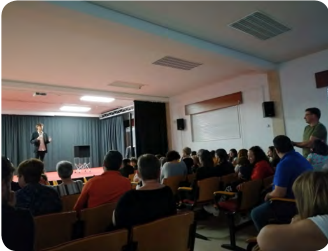
Actuación de maxia organizada pola ANPA Ceip Ortigueira.