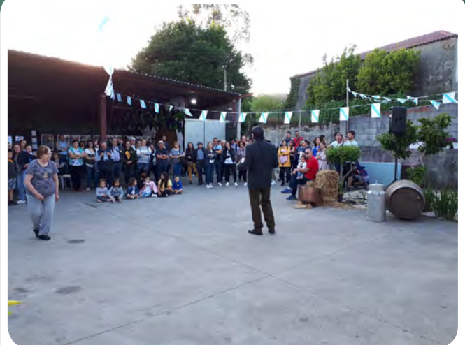
Así foi a Foliada do Serán das Letras da Asociación Cultural San Campio.