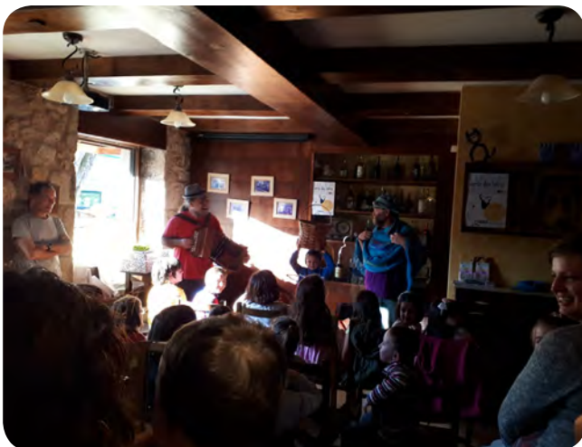
Entrega de premios do Concurso do Serán das Letras da Asociación Cultural San Campio.