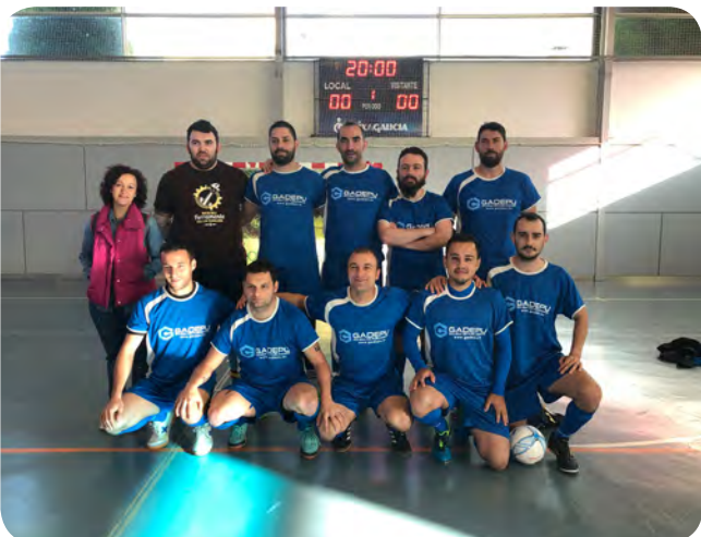
Participación de Vedra no Torneo de Fútbol Sala Intermunicipal 2019, celebrado en Arzúa