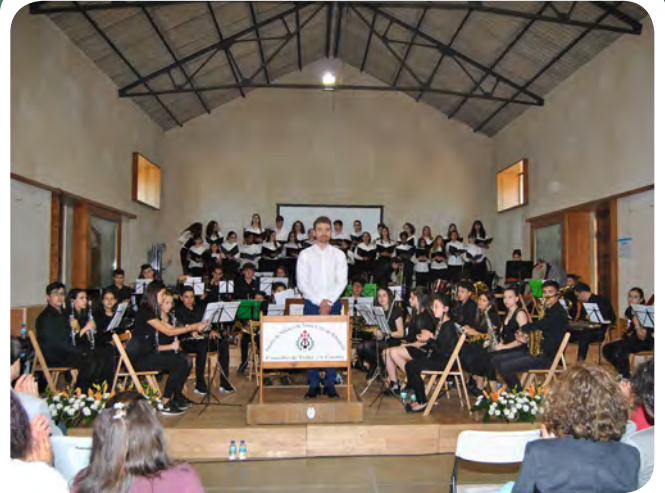
Concerto da Escola de Música de Santa Cruz de Ribadulla coa Escolanía da Catedral de Santiago.