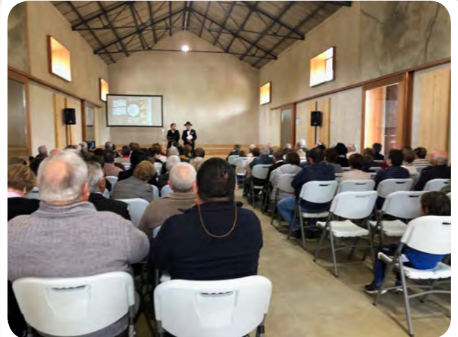
Programa cultural das nosas letras... Venres 17 de maio ás 11:00 h. na Nave da Estación: Festival das nosas letras.