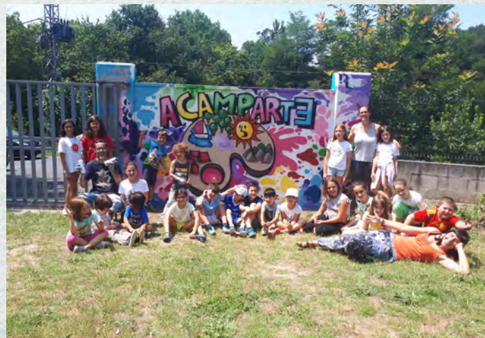
Imaxe da edición pasada do Acamparte do CEIP Ortigueira.