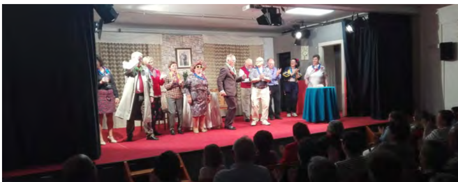
Actuación do Grupo de Teatro de maiores do Centro Social de Vedra en Santa Cruz.

■ Escola do Móbil: “Actualízate co WhatsApp” Luns 10 de xuño ás 20:00 h. no Centro Social.