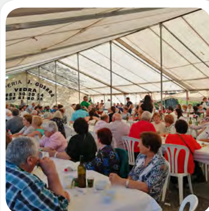
Festa do Pulpo en Vedra.