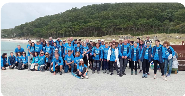
Última etapa de sendeirismo antes do descanso estival.