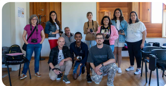
Curso de Fotografía no Centro de Emprendemento A Estación.