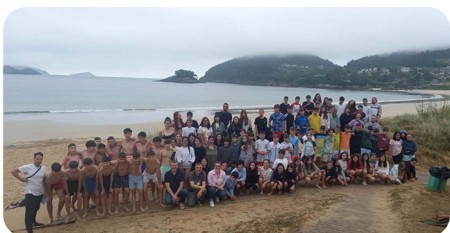
Campamento de mar verán 2024.