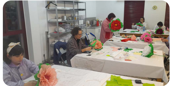
Clase de manualidades na Casa das Artes.