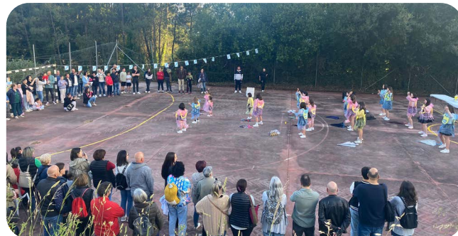
Festa d@ Soci@ da Asociación Cultural San Campio.