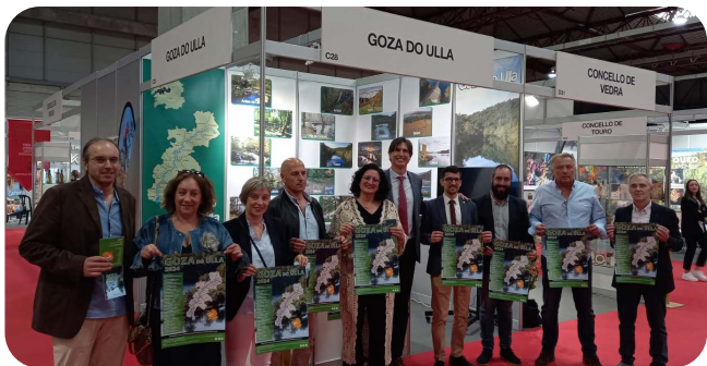
Presentación do Programa Goza do Ulla na Feira de Silleda.