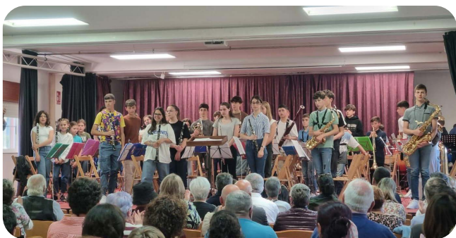
Festival de Fin de Curso da Escola de Música de Santa Cruz de Ribadulla.