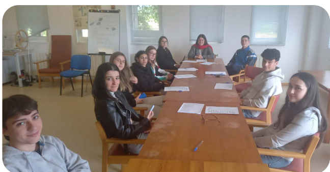
Reunión do voluntariado xuvenil para o inicio das accións programadas para este verán.