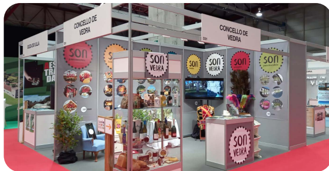
Presentación do stand de Vedra na Semana Verde de Silleda.