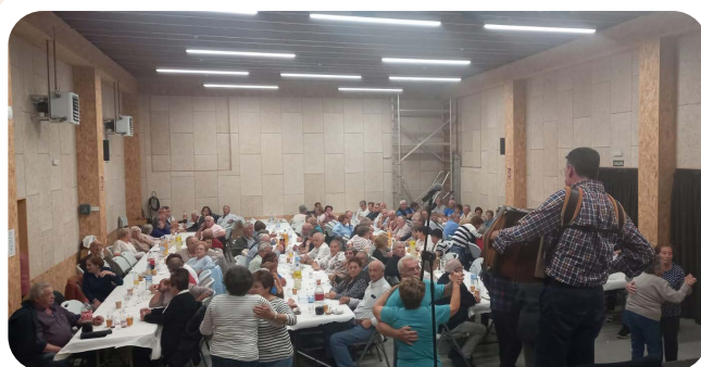
Sardiñada polo San Xoán da Terceira Idade.