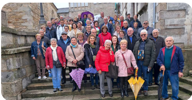
Excursión da Asociación O Burgo a Ribadeo e praia das Catedrais.