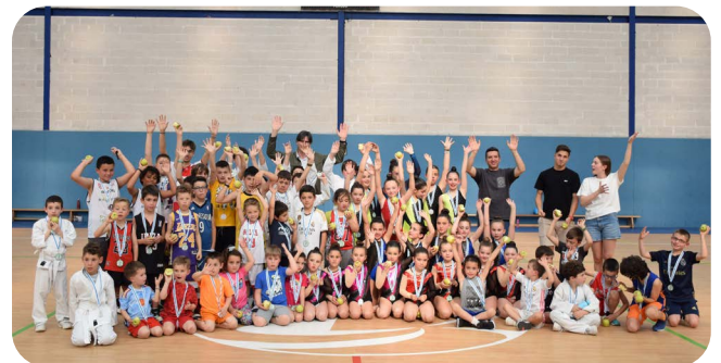
Fin de Curso das Escolas Deportivas de Vedra.