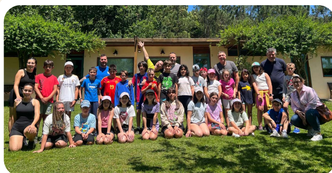
Minicampamento de verán 2024.