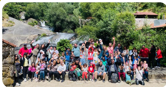
Excursión organizada pola ANPA do CEIP Ortigueira.