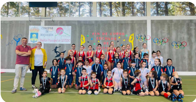
Fin de Curso das Escolas de Patinaxe de Vedra e Boqueixón.