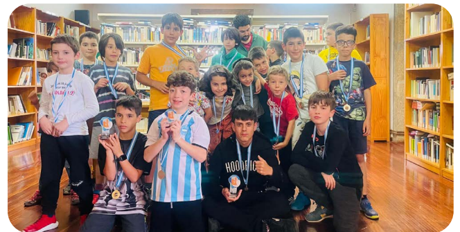
Torneo de Fin de Curso da actividade de xadrez.