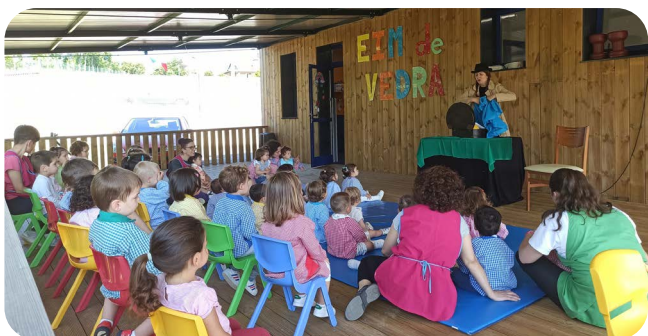
Sesión de Conta Contos de Raquel Queizás na EIM de Vedra a través do Programa Rede Cultural 2024.