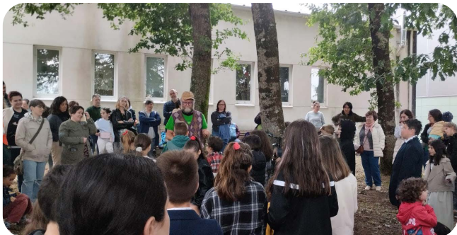
Fin de Curso da Actividade de Teatro da Asoc. Cultural Papaventos.