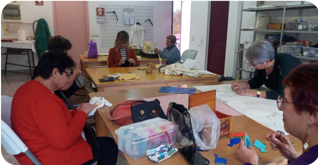
Clase de costura na Casa das Artes.