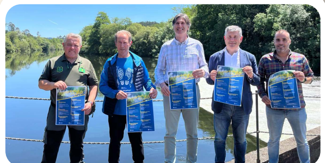
Presentación do Programa Correntes do Ulla.