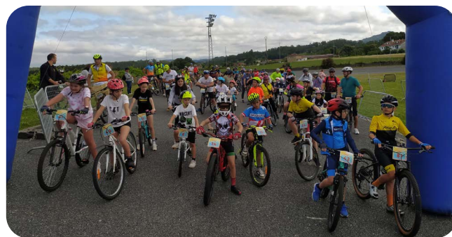
Día da Bicicleta coa Asociación Ribadoulla.