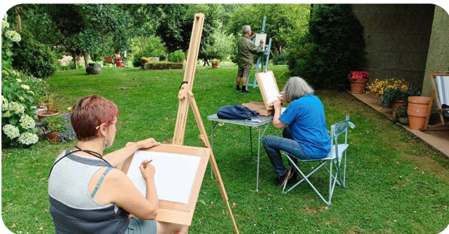
Clase de pintura na Casa das Artes.