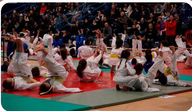
Trofeo de Judo de Nadal Kumi Kata.