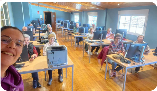
Curso de Alfabetización Dixital na Aula Cemit de Vedra entre os meses de outubro a decembro de 2024.