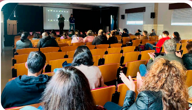
Presentación de resultados do Proxecto "Efecto Bolboreta" da Anpa do CEIP Ortigueira.