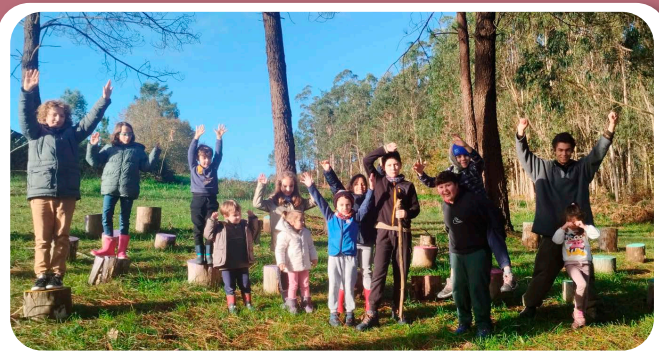
Escola Ambiental polo Nadal coa Asociación Amabul.