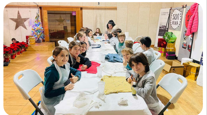
Obradoiro Customización de Prendas con Ondas do Mar, no Mercadiño de Nadal.