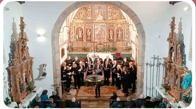
Concerto de Nadal da Coral Polifónica de Santa Cruz.