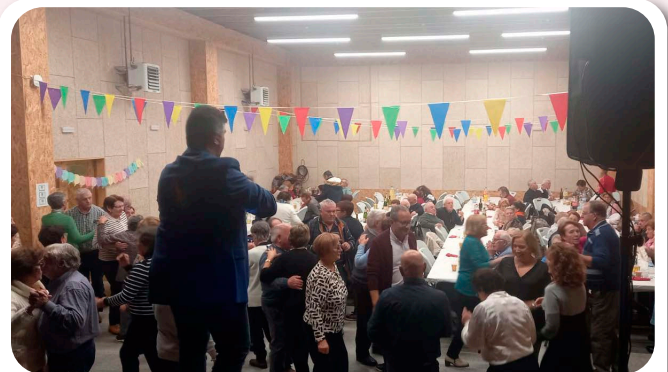
Baile-Merenda de Nadal e Fin de Ano no Centro Socio Cultural.