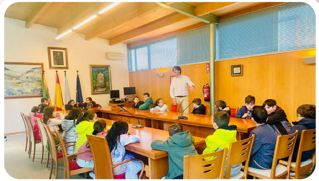
Visita de 3º de primaria do CPI de Vedra ás dependencias municipais.