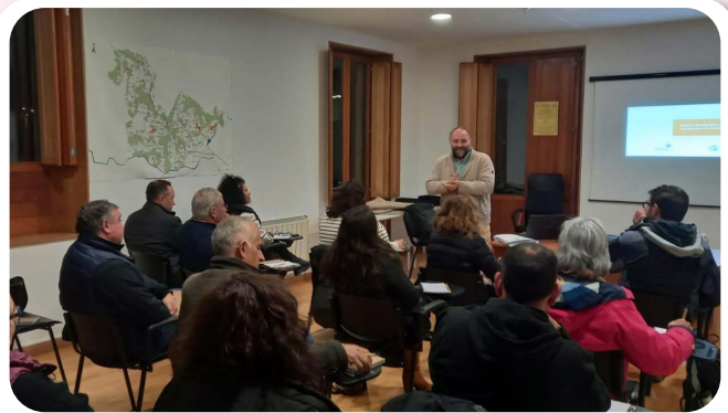
Curso de Iniciación á Xestión Económica e Financeira de Asociacións.