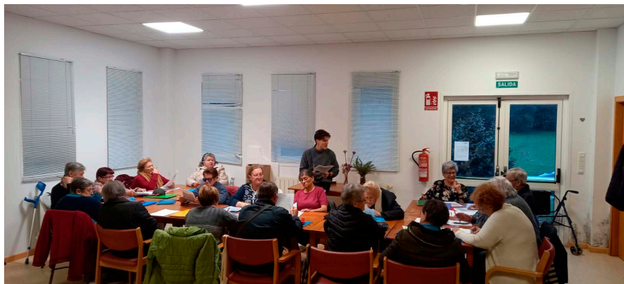
Un dos grupos do obradoiro de memoria.