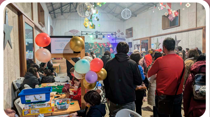
Festa de Nadal da Anpa do CEIP Ortigueira.