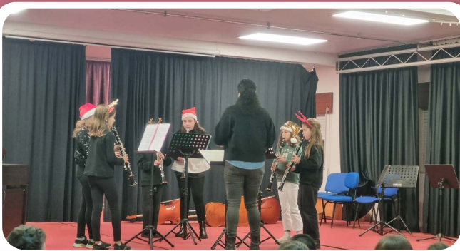
Audicións en familia da Escola de Música de Santa Cruz de Ribadulla.