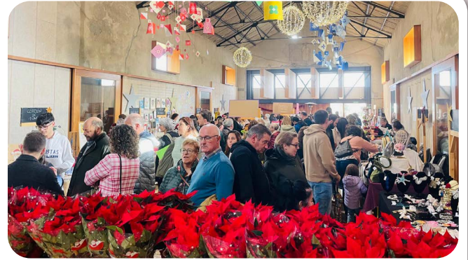
Vista xenérica do Mercadiño.