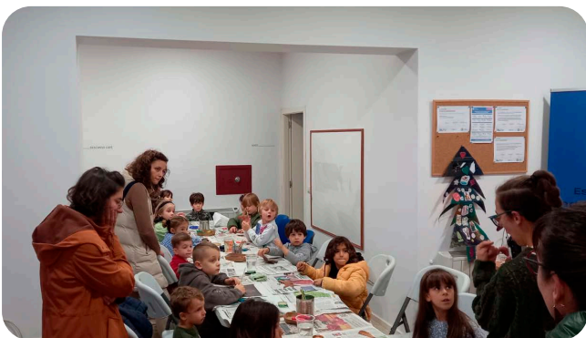
Obradoiro adornos de nadal con refugallo, no Mercadiño de Nadal.