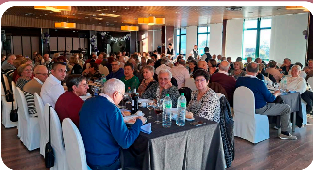
Xantar de confraternidade polo Nadal da Asociación da Terceira Idade O Burgo.