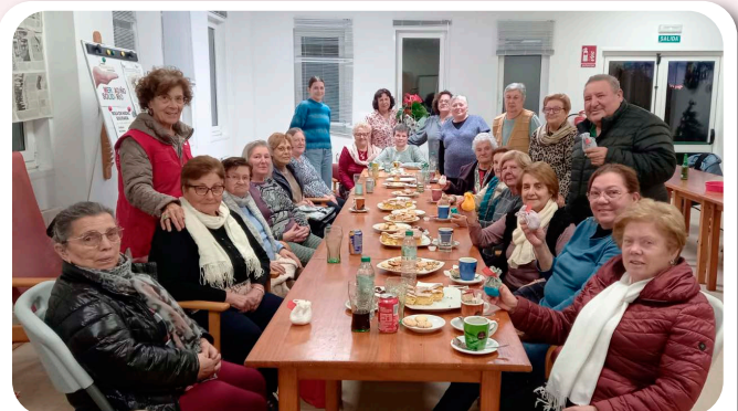
Encontro dos grupos de laborterapia Nas Mans da Avoa e a Cruz Vermella Santiago.