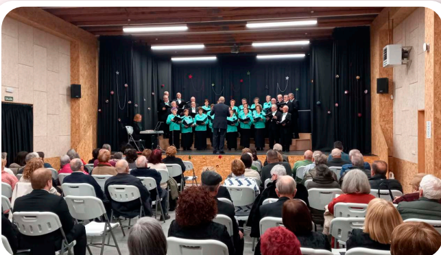
Certame de Nadal de Corais no Centro Socio Cultural de Vedra.