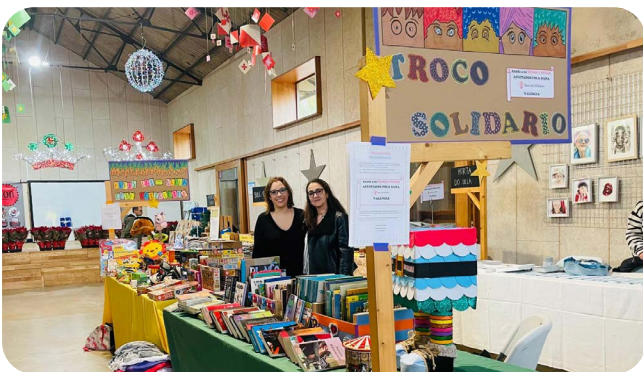
Posto Solidario das Anpas do CEIP Ortigueira e do CPI de Vedra no Mercadiño Solidario.