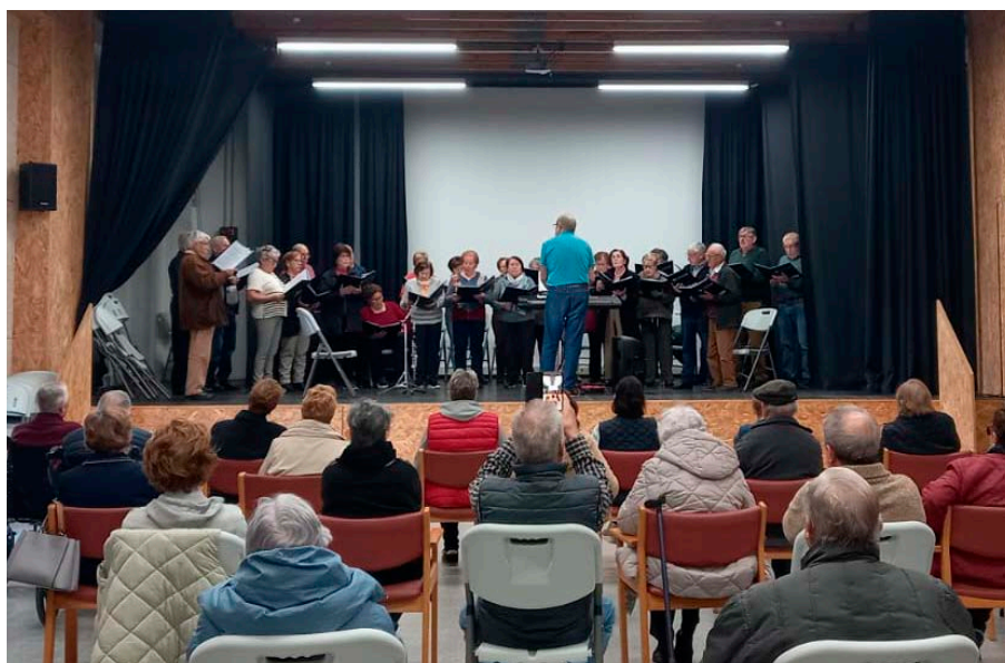
Celebración do Día da Música con AGADEA no Centro Social.