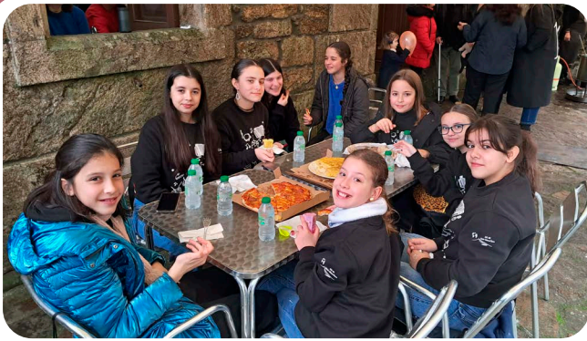
A Feira de Nadal en Ponte Ulla.