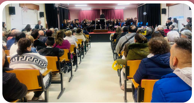
Festival de Nadal da Escola de Música de Santa Cruz de Ribadulla.