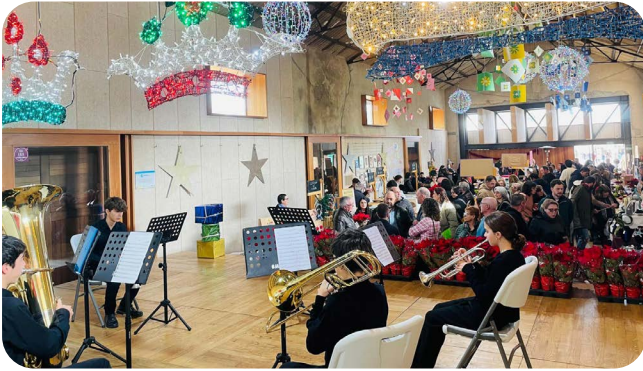
Actuación da Escola de Música de Santa Cruz de Ribadulla, no Mercadiño de Nadal.