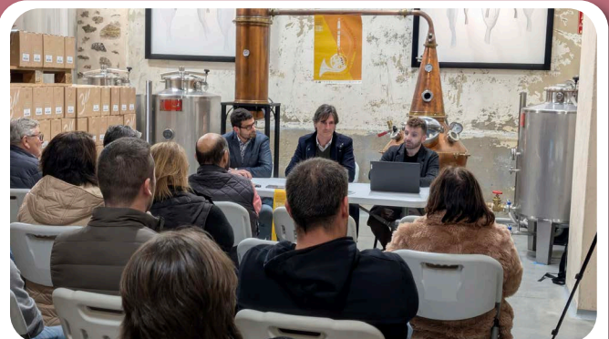
Presentación do Concerto Conxunto da Escola de Musica de Santa Cruz de Ribadulla e a Requiñta da Laxeira.