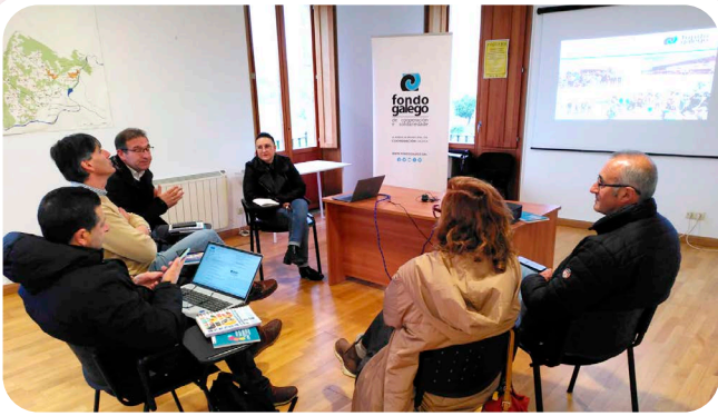
Asamblea do Fondo Galego de Cooperación e Solidariedade en Vedra.