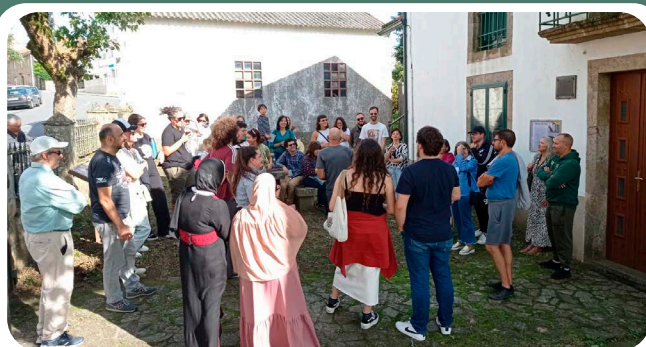
Homenaxe á emigración vedresa "Historias Migrantes" organizada polas asociacións culturais Papaventos e Raiceiros.