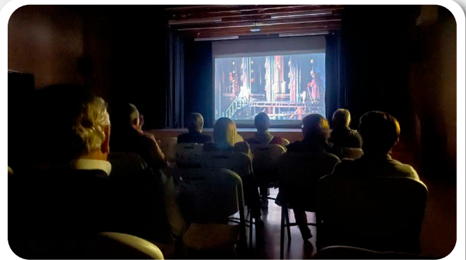
Retransmisión en directo dende o Teatro Real de Madrid da Ópera Adriana Lecouvreur.