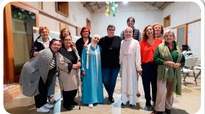
Presentación do podcast As Herbas da Avoa.