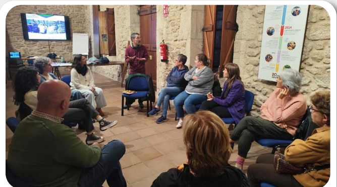
Actividade “Mulleres fronte a emerxencia climática”.