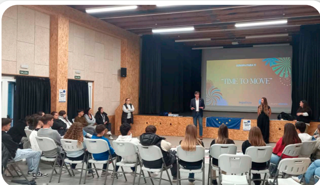
Quedada coa mocidade - Europa para Ti.