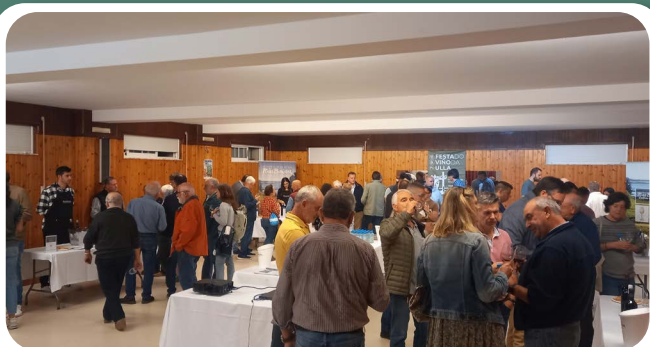
Tunel do viño da comisión "Festa do Viño da Ulla de San Miguel de Sarandón".