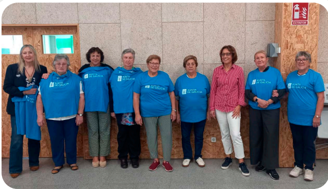
Xuntanza das integrantes do voluntariado senior.