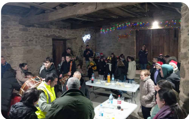
Cantarelas de Nadal da Asociación Cultural San Campio.