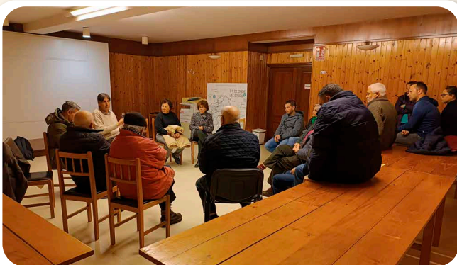
As xuntanzas do alcalde polas doce parroquias que rematan nos inicios deste mes de febreiro.