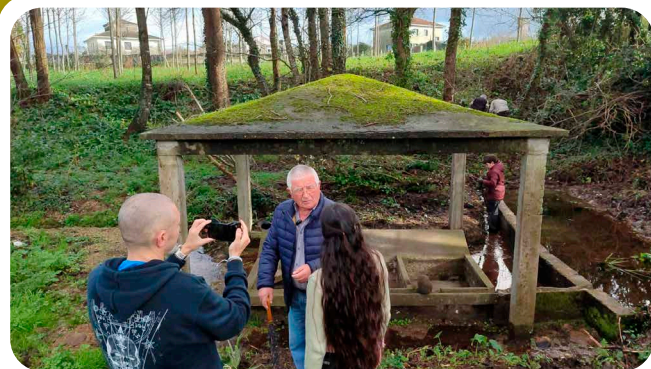
Voluntariado do proxecto Faladoiros de Amabul facendo traballo de recuperación da memoria ambiental e de xénero no lavadoiro de Fontao.