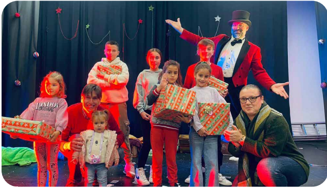
Acto de Entrega de Premios do Concurso de Tarxetas de Nadal.