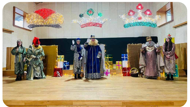
Visita dos Reis Magos á Nave da Estación.