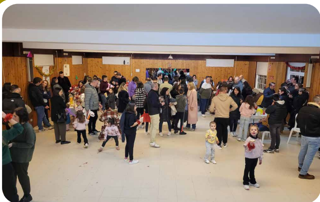
Festa familiar de fin de ano da Asociación Cultural San Campio.