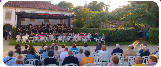
XXI Festival de Bandas de Música do Patio.