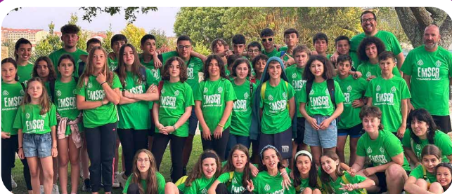
Campamento Musical de Verán da Escola de Música Santa Cruz de Ribadulla.