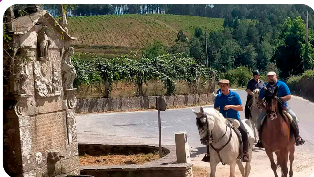
XV Ruta Cabalar do Santiaguíño da Asociación de Cabaleiros do Santiaguíño.