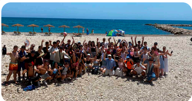
Viaxe do Verán para a mocidade.