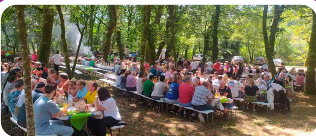
XIII Festa do Chourizo en San Pedro de Sarandón.