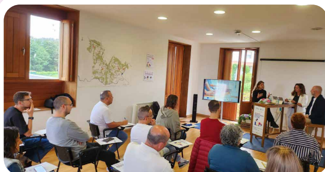
Sesión da actividade de IA no Centro de Emprendemento de A Estación.