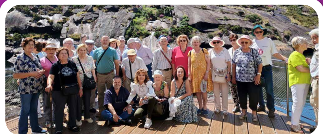
Actividades da Asociación O Burgo para a 3ª Idade de Vedra.