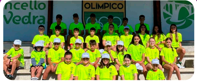
Alternativas asociativas de conciliación no verán: Campus Deportivo do Club Olímpico de Vedra.