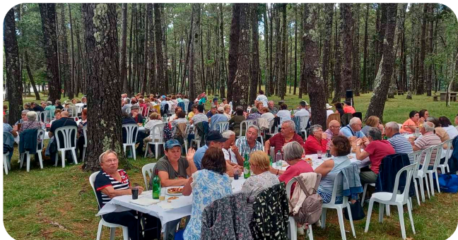
Excursión do verán da terceira idade que este ano visitou Boiro.