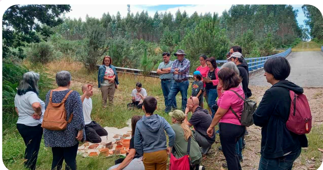
Unha das rutas polo Patrimonio Oculdo de Vedra.