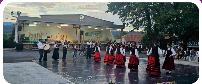
Festival Folclórico da Asociación Cultural San Campio en San Miguel de Sarandón.