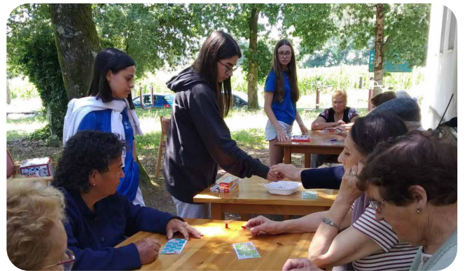
Reunión interxeracional coa xuventude do voluntariado de Vedra e do Campo de Voluntariado Unindo Roteiros co grupo de terapia con Agadea Alzheimer.