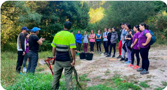
Campo de Voluntariado Unindo Roteiros.