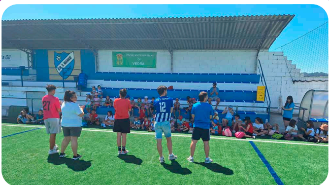
Actividade de colaboración do CD San Mamede co Ludoverán.