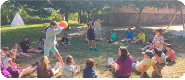
Alternativas asociativas de conciliación no verán: Acamparte da Anpa do CEIP Ortigueira.