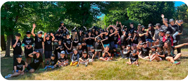
Alternativas asociativas de conciliación no verán: Escola Ambiental da Asociación Amabul.