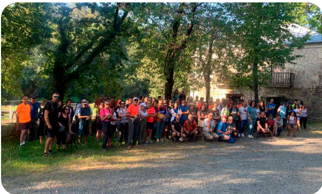
Etapa do Goza do Ulla dende O Coto de Ximonde ata Pontevea.