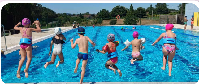
Tempada de piscina.