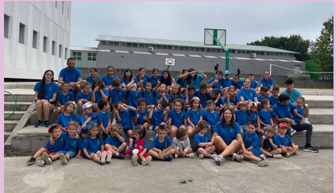
Foto da Ludoverán 2024.

Máis información nos teléfonos 699 041 486 / 981 814 693 en horario de 9:00 a 13:00 h.