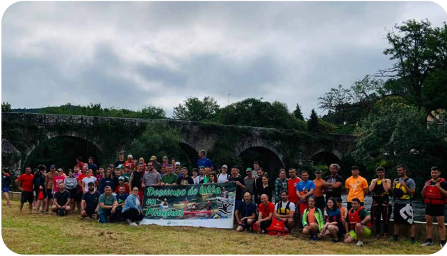
Descenso do Ulla en Piraguas con preto de 100 persoas participantes.