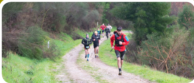
IV Maratón de Montaña "A Camelia" do Club de montaña Vértice, que nesta ocasión organizou tres categorías ou opcións para participar: O Maratón de Montaña con 46 km, o II Trail con 13 km. e a I Andaina con 13 km. Lembra que podes ver as clasificacións e toda a información na páxina de facebook do club de montaña Vértice.