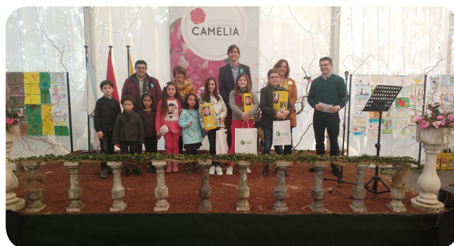
Entrega de premios do 18º Concurso de debuxo infantil da camelia.