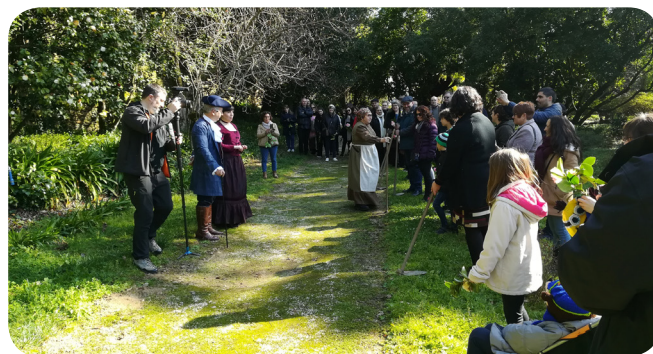
Visita teatralizada no Pazo de Ortigueira coa Asociación Papaventos.