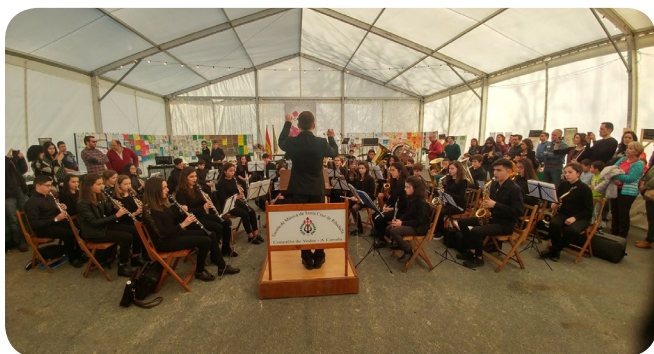
Actuación da Escola de Música de Santa Cruz de Ribadulla.