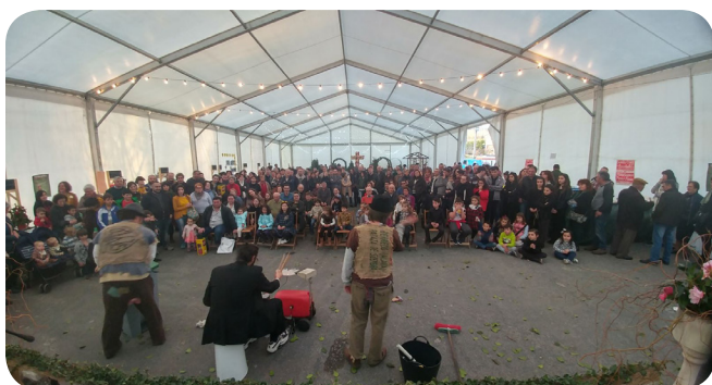
Actuación do Trío Refugallo.