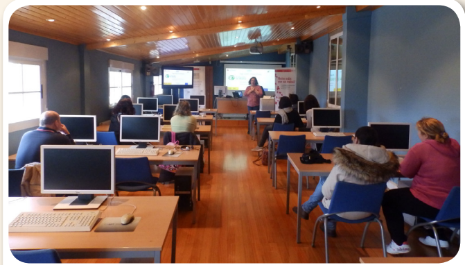
Xornada presentación actividades relacionadas co emprego da Cruz Vermella.