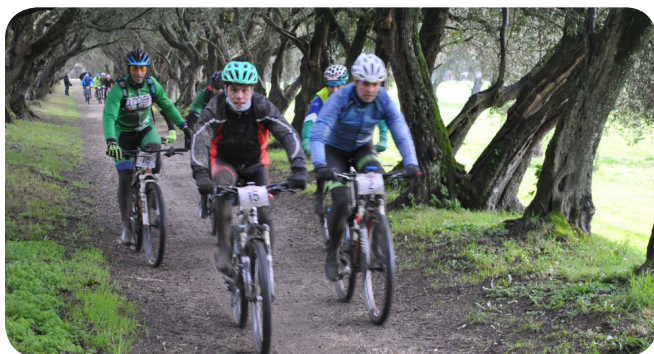
Ruta BTT da Camelia.