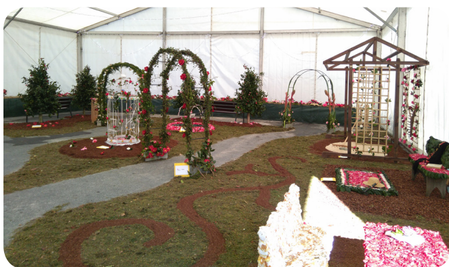
Vista dos traballos ornamentais con camelia.