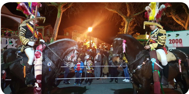
Entroidos dos Xenerais da Ulla en San Xián. E na primeira fin de semana de marzo o broche final da festa dos Xenerais da Ulla estará en Vilanova.