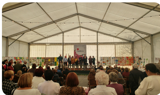
Momento da inauguración das XXIII Xornadas Arredor da Camelia.