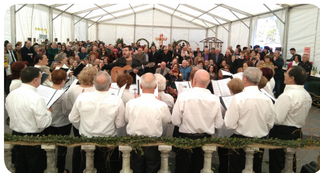
Actuación do Coro Habaneras da Rocha Forte.