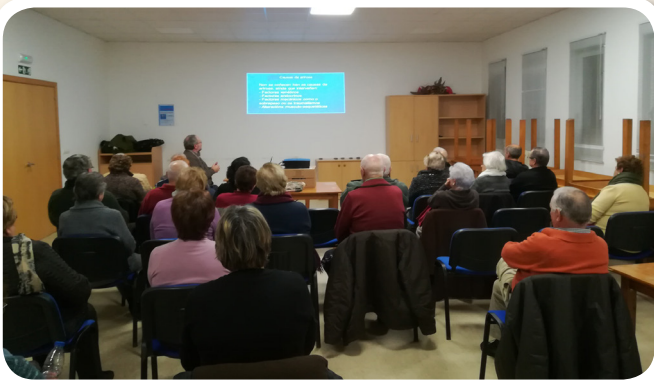
Charla na Escola de Saúde da Terceira Idade sobre a Artrose.